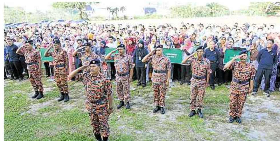
Ahli Bomba MPOB melakukan perbarisan tabik hormat sebelum memulakan aktiviti 'firedrill', aktiviti pencegahan dan membantu mangsa kemalangan kebakaran.

Kecemerlangan sesebuah organisasi membabitkan perubahan dari aspek kualiti perkhidmatan, pengetahuan dan kemahiran serta kualiti peribadi masing-masing.