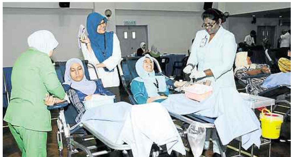
Peserta mengambil bahagian dalam aktiviti derma darah yang dijalankan.