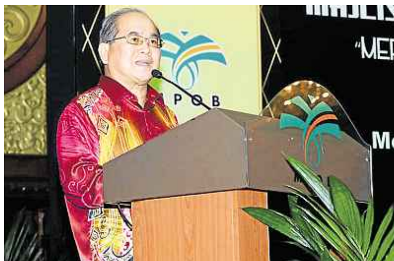
Datuk Amar Douglas Uggah Embas berucap merasmikan Majlis Makan Malam dan Anugerah MPOB 2013 .

“Pembudayaan inovasi memerlukan strategi untuk beranjak daripada kaedah penyampaian perkhidmatan secara konven-