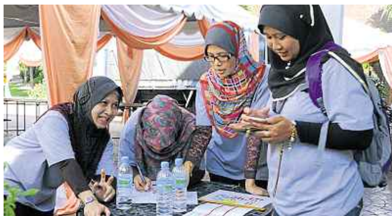
Peserta berbincang bagi mencari jawapan kepada soalan yang disediakan semasa aktiviti Walk Hunt dijalankan.

menunjukkan prestasi yang cemerlang menerima anugerah masing-masing dalam pelbagai kategori. Antara anugerah yang disampaikan ialah seperti berikut: