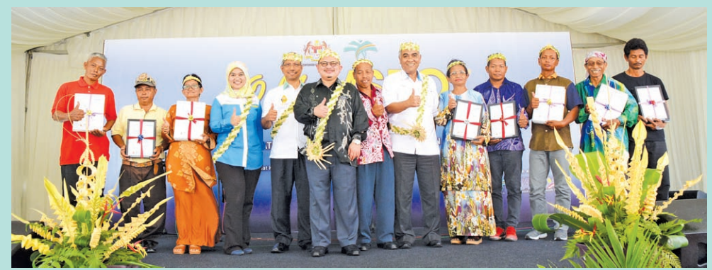
DATUK Seri Shamsul Iskandar bersama pekebun kecil orang asli yang memperoleh sijil MSPO.

Katanya, bagi sektor ladang dan kilang, insentif disediakan adalah berdasarkan keluasan ladang iaitu bagi yang kurang 1,000 hektar, 70 peratus insentif kos pensijilan manakala bagi ladang melebihi 1,000 hektar, 30 peratus insentif kos pensijilan. Kilang pula akan menikmati 30 peratus insentif kos pensijilan.