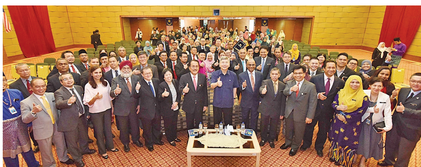
DATUK Seri Mah Siew Keong bersama warga kerja MPIC.

Program Hello Komoditi anjuran MPIC sebagai usaha untuk meningkatkan kesedaran awam terhadap sektor komoditi negara dan menghebahkan kepada pihak berkepentingan mengenai perkembangan industri serta bantuan yang diberikan oleh kerajaan untuk pengusaha industri komoditi negara.