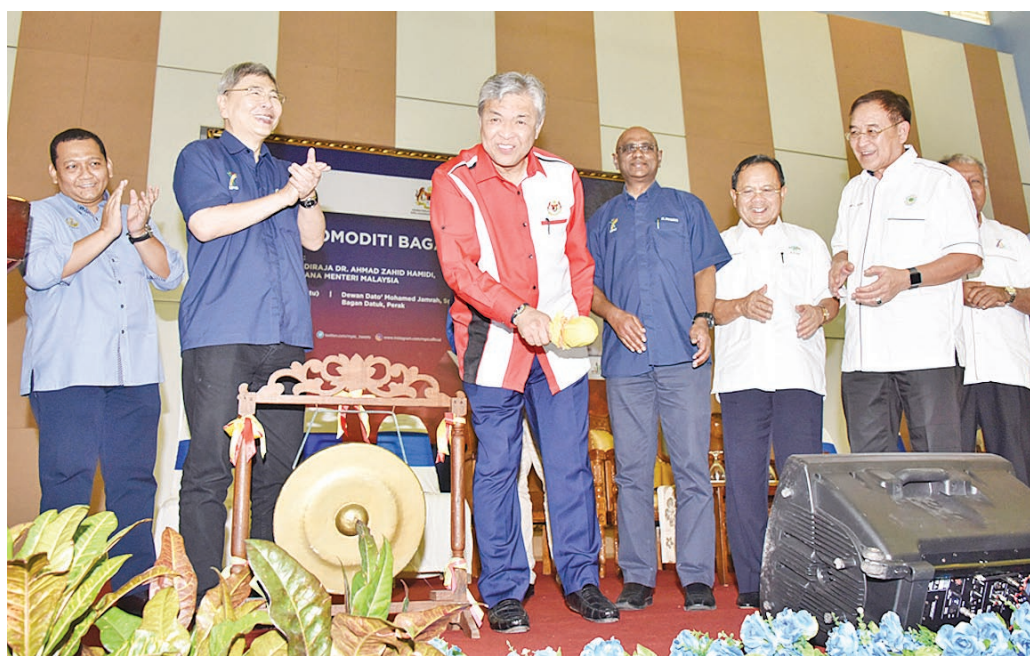
DATUK Seri Dr Ahmad Zahid Hamidi ketika merasmikan Hello Komoditi Bagan Datuk.

Datuk Seri Dr Ahmad Zahid Hamidi berkata demikian ketika mengulas tindakan Kesatuan Eropah (EU) yang kini dalam proses untuk memberhentikan penggunaan bio bahan api di EU menjelang tahun 2021.