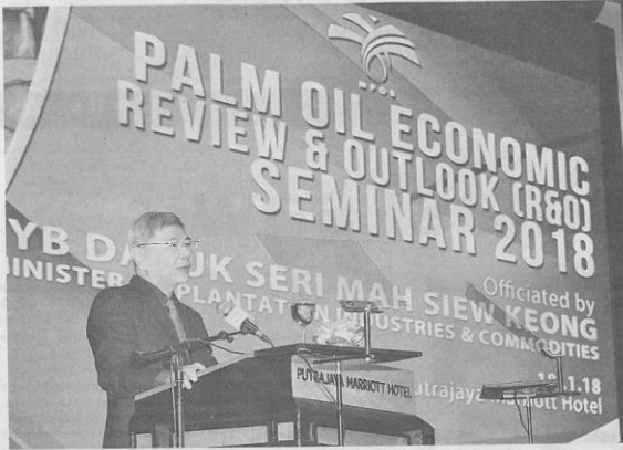
DATUK Sri Mah Siew Keong semasa berucap merasmikan R&O Seminar 2018 di Putrajaya.