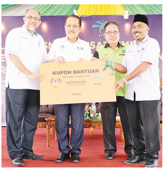
DATUK Datu Nasrun Datu Mansur menyampaikan kupon bantuan integrasi ternakan kepada pekebun kecil sawit.

“Kerajaan menyediakan peruntukan sebanyak RM1.12 juta untuk disalurkan kepada