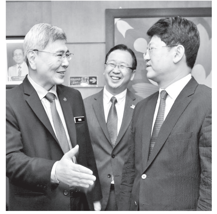
DATUK Seri Mah Siew Keong dan Bai Tian beramah mesra ketika kunjungan ke MPIC di Putrajaya.

Katanya lagi, adalah menjadi komitmen negara untuk terus memperjuangkan masa depan industri sawit di Malaysia dan juga luar negara. Selain itu, katanya Malaysia turut fokus dalam memastikan kelestarian alam sekitar terus terpelihara disamping mengutamakan kepentingan pekebun kecil di negara ini.