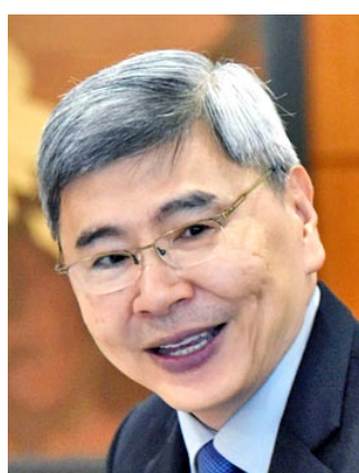
Datuk Seri Mah Siew Keong

Menteri Perusahaan Perladangan dan Komoditi, Datuk Seri Mah Siew Keong berkata, eksport sektor komoditi 2017 mencatatkan nilai tertinggi pada RM141.1 bilion sejak tahun 2011 di mana pendapatan eksport produk-produk komoditi adalah sebanyak RM140.3 bilion atau 15 peratus daripada keseluruhan pendapatan