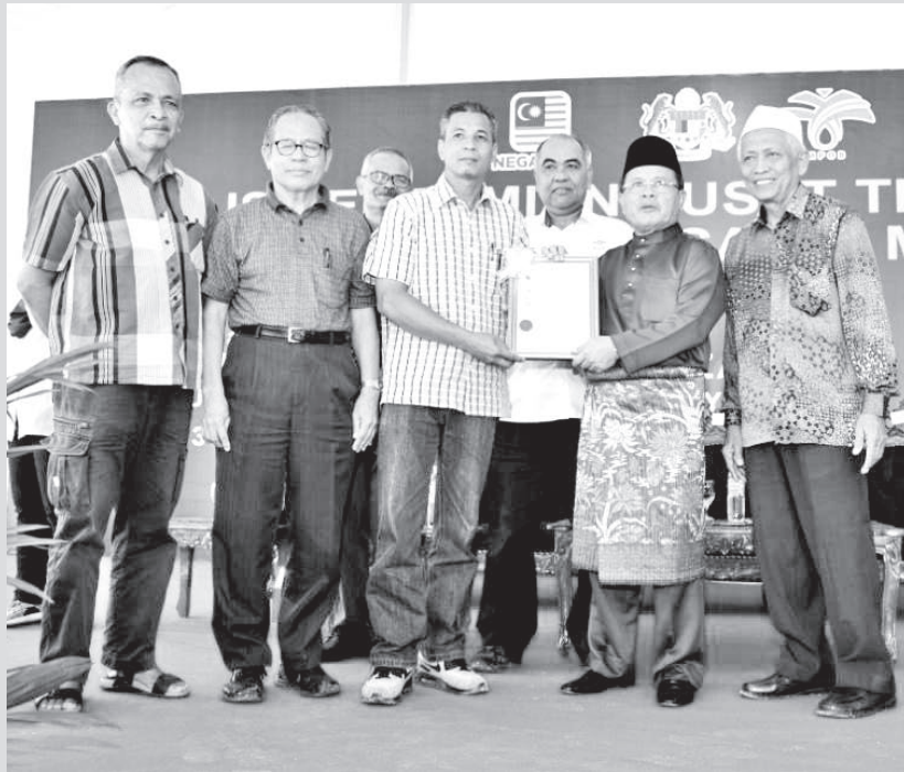
DATUK Seri Ahmad Hamzah menyampaikan sijil MSPO kepada wakil Kelompok Minyak Sawit Mampan (SPOC) Sungai Rambai, Melaka.

penting terhadap usaha meningkatkan keupayaan pekebun kecil yang mengusahakan tanaman sawit secara persendirian bagi mencapai peningkatan pengeluaran hasil buah sawit berkualiti.