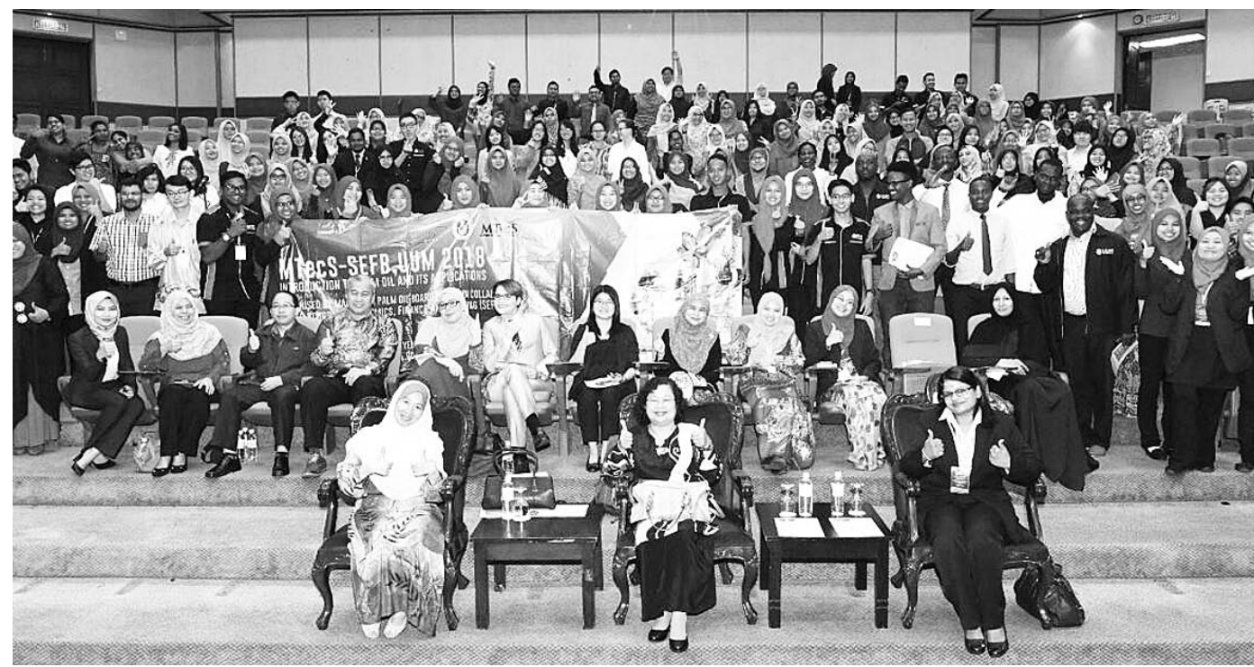
SEBAHAGIAN warga UUM yang menyertai MTecS-SEFB, UUM 2018.

mengambil peluang ini berinteraksi dengan MPOB untuk membincangkan kerjasama penyelidikan yang berpotensi dan memperbetulkan pelbagai tanggapan salah dan juga persepsi negatif mengenai minyak sawit.