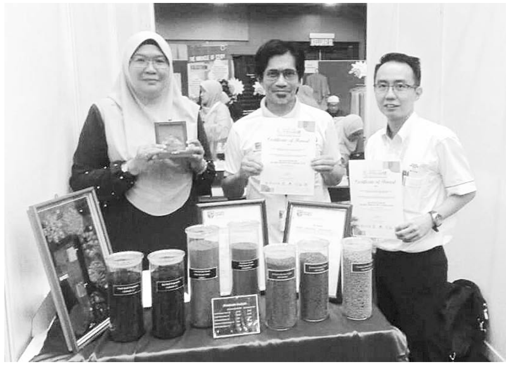
PEGAWAI penyelidik MPOB yang memenangi pingat di i-INOVA 2018 di Nilai, baru-baru ini.